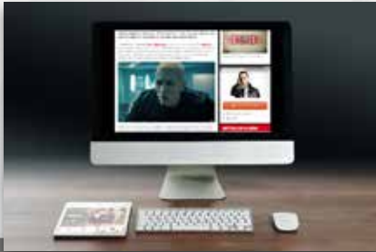
UNIVERSAL MUSIC Musik und Entertainment