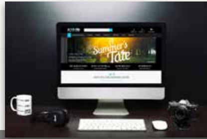
ARTISTXITE Musik und Events