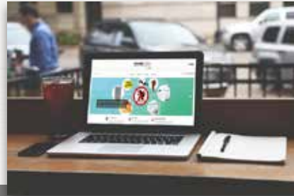
KRUGER MEDIA Entertainment, Ratgeber und Start-Ups