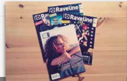
RAVELINE MAGAZIN Musik und Events