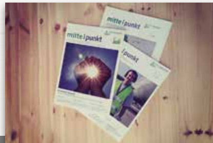
MITTELPUNKT MAGAZIN Wirtschaft und Kultur