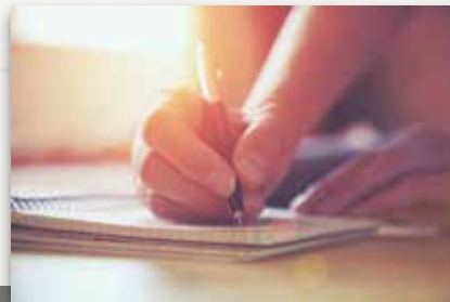
ABCREATIV Immobilien und Tourismus