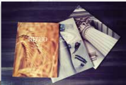
REGJO MAGAZIN Wirtschaft und Kultur