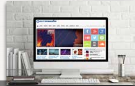
ARMANDA MUSIC Musik und Entertainment