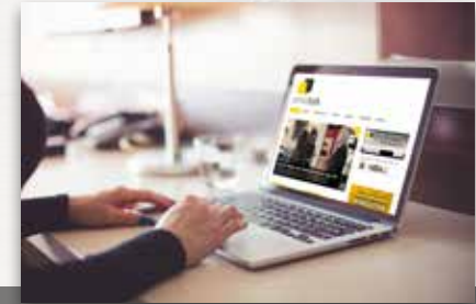
KICK MEDIA Entertainment